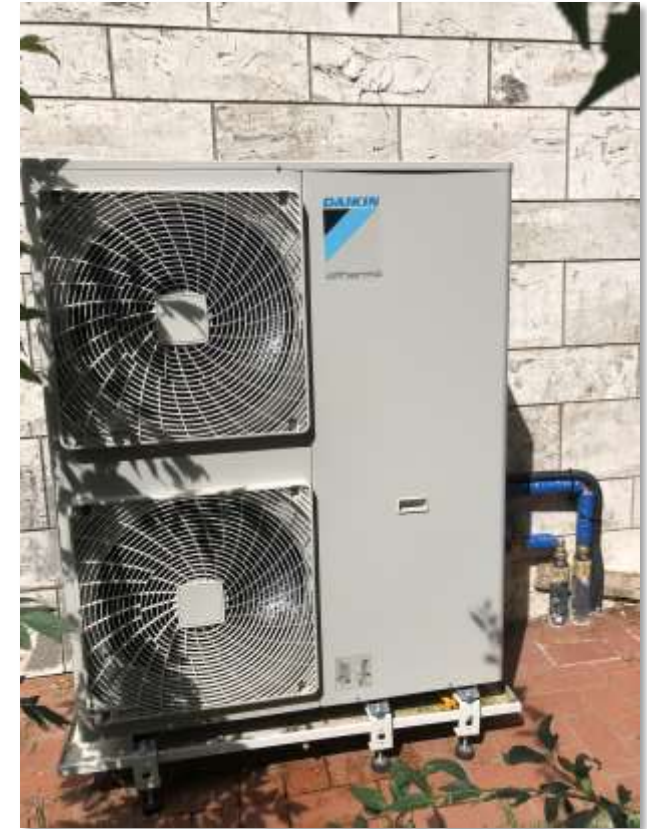
pompa di calore